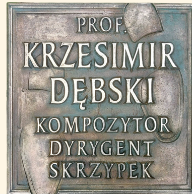
Tablica Krzesimira Dębskiego autor: Bartłomiej Sęczawa

"Widok na Aleję Sław" - akwarela, Tadeusz Grygiel 2008